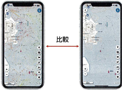
プレミアムの等深線